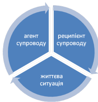
Рис. 1. Модель горизонтальної структури соціально-психологічного супроводу

Інший спосіб побудови моделі супроводу можливий, коли за основу береться її процесуальна, динамічна функціональність. У такому випадку соціально-психологічний супровід розглядається перш за все як процесуальне явище, мінливе, динамічне, цілеспрямоване і досить тривале. Відповідно, структуру супроводу можна представити як послідовне розгортання окремих етапів, кожен з яких має свою мету і спрямованість. Така структура апріорі рухлива, і зміст її трансформується на кожному наступному етапі.