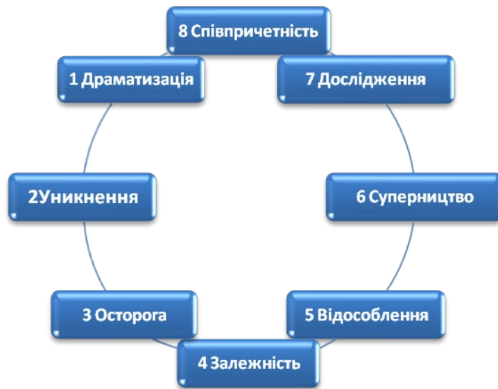
Рис. 1. Топографія позиціонування себе світові в модусах переживань

канву подолання труднощів. Ця метафора дає змогу пояснити складні процеси «так, щоб вони стали зрозумілими і дитині» (Е. Берн), та зберегти еволюційну логіку пристосування до ситуації, яка нині, як наслідок запису в « tabula rasa », створює «тіло переживань» клієнта.